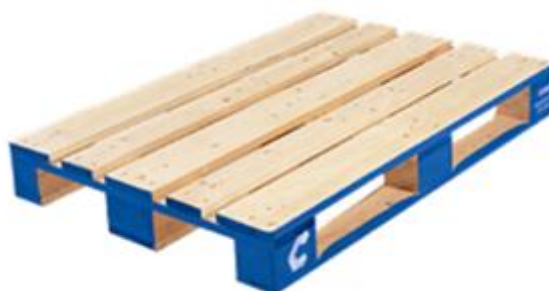
CHEP Fél / DD raklap 60 x 80 cm